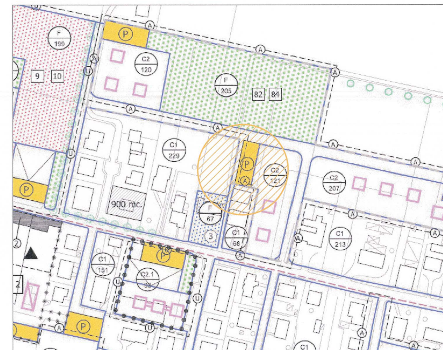
ESTRATTO DI P.R.G. PROVINCIA DI PADOVA COMUNE DI VILLANOVA DI CAMPOSAMPIERO PIANO PARTICOLAREGGIATO "MUSSOLINI" scala 1:2000