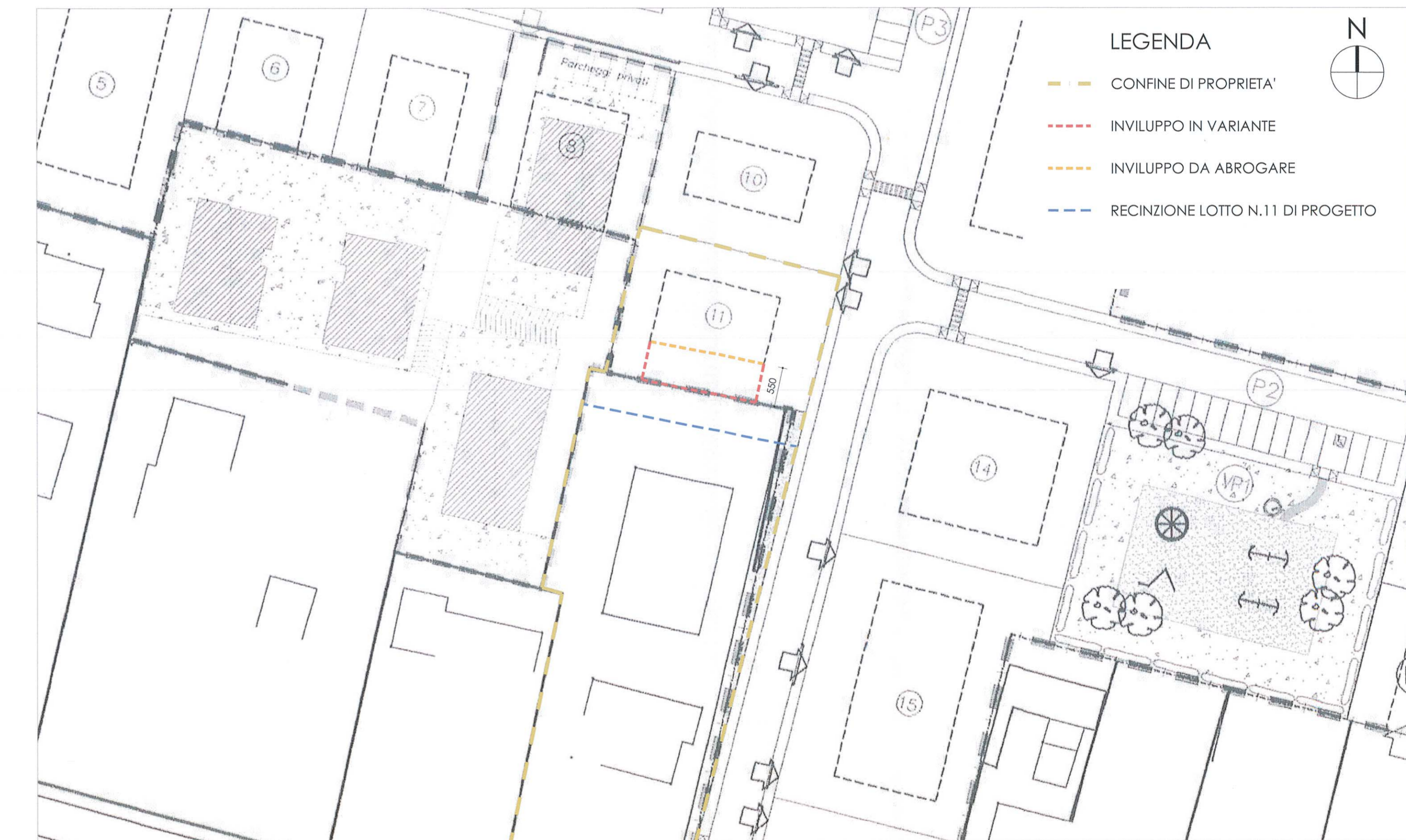
Planimetria stato comparativo - scala 1:500

Comune di Villanova di Camposampiero Provincia di Padova